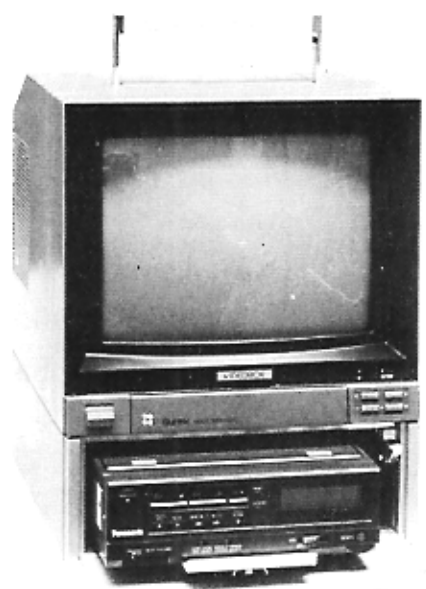
VIDEOBOX P 29